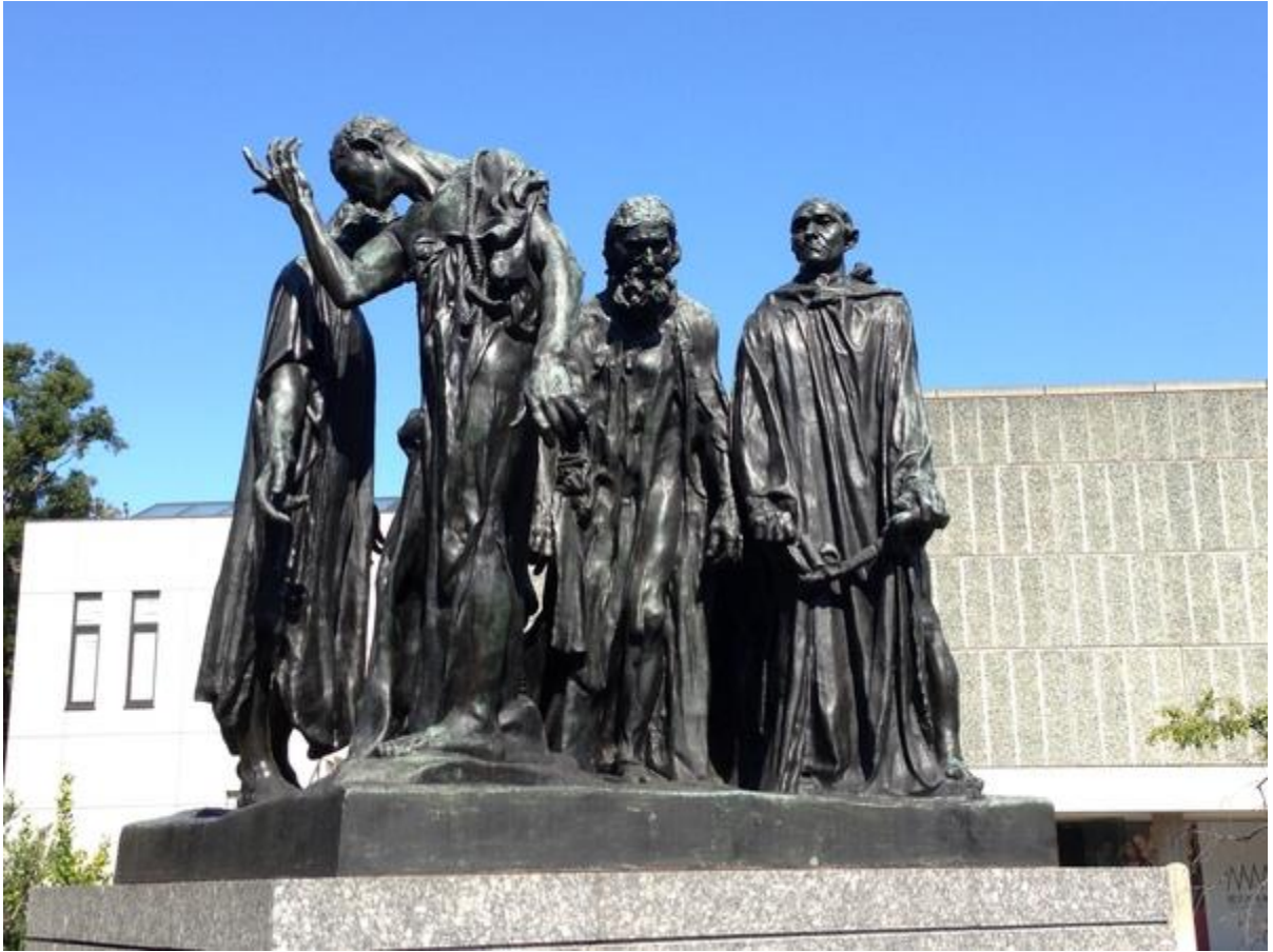
卡來市民(羅丹名作)

相對於卡蜜兒的落魄潦倒，羅丹的晚年則大鳴大放。1900年，他在巴黎世界博覽會展出150 件作品，奠下他在世界藝術史上頂級大師的地位。此後，世界各國爭相邀請他作巡迴展出。