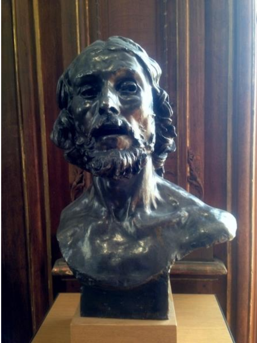
施洗者約翰—羅丹作品