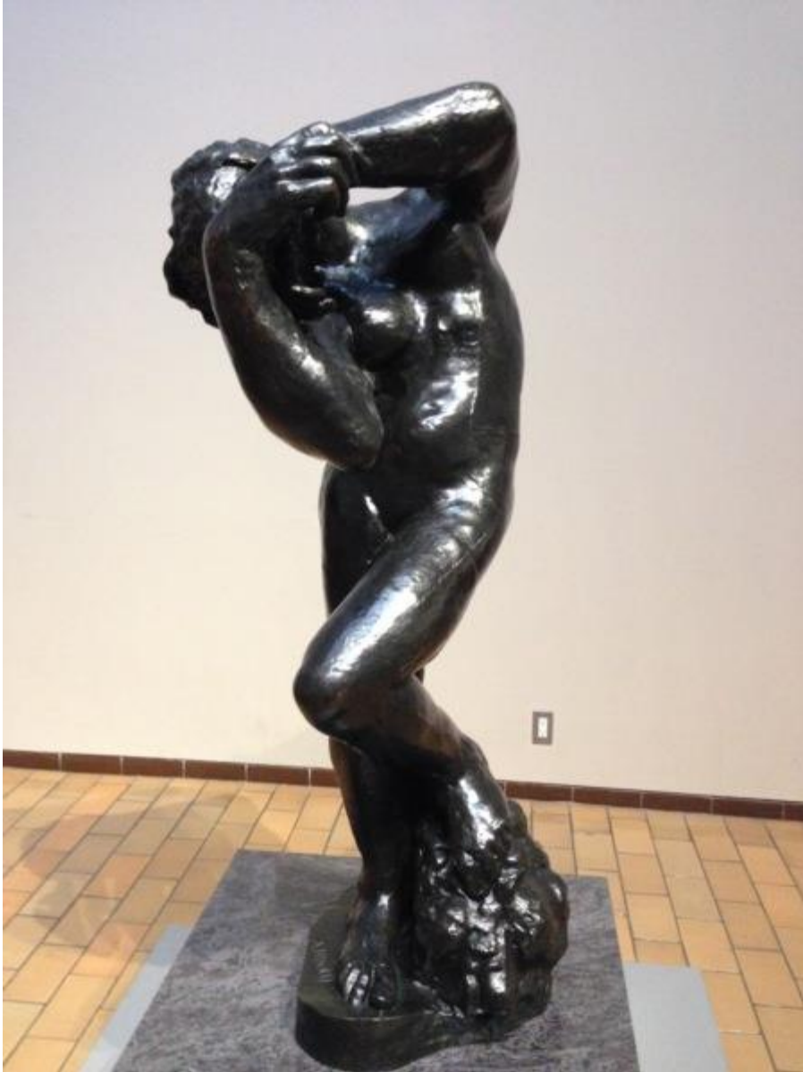
The Age of Bronze (青銅時代)

1880年，法國政府計劃興建一座工藝美術館，委託羅丹為該館製作一扇大門。羅丹對這項委託極為審慎。他思及著名的義大利佛羅倫斯聖約翰大教堂的青銅浮雕大門為「天堂之門」，乃欲以義大利最偉大的文學家但丁(Dante Alighieri)著的《神曲》第一篇〈地獄〉為主題，製作一扇充滿人性情慾、罪惡與悔恨的「地獄門」。