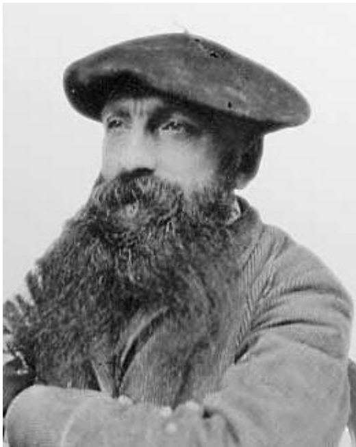
羅丹(August Rodin, 1840-1917)

羅丹是法國二十世紀最著名的雕塑家，享有「現代雕塑之父」之譽，更有人稱之為「自米開蘭基羅(Michelangelo)以來最偉大的雕塑家」。