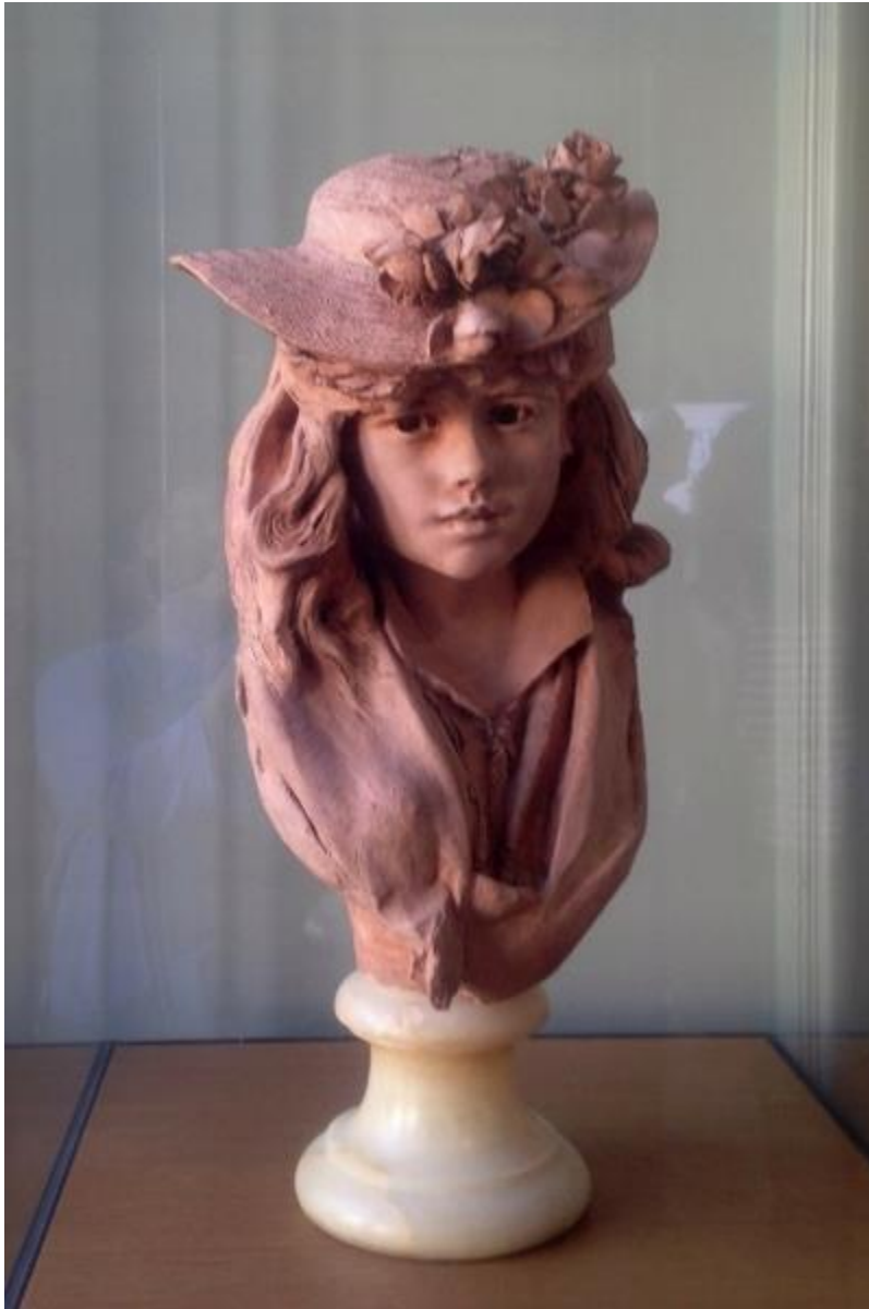
戴小花帽的少女(羅丹作品)

後花園的林蔭樹下，更立著許多尊擺著各種姿勢、臉帶各種表情的青銅人物雕像， 個個表情逼真，身體的線條勁道十足。