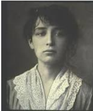
Camille Claudel (1864-1943)

卡蜜兒那時才十九歲，來自一個富裕的家庭。因為自幼喜愛雕塑，在當時巴黎藝術學院尚不收女生的年代，她即在父親的支持下，至一位名雕塑師處學習。在那兒，她遇上四十三歲的大師羅丹，開始展開一段不尋常的際遇。