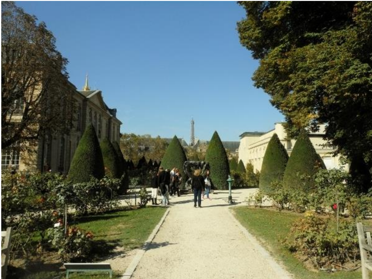
座落拜隆大廈(Hotel Biron)的羅丹藝術館

1917年，羅丹終於與共同生活了53年的Rose Bueret 完婚。兩人於那年先後去逝，合塚長眠。羅丹享年77歲。