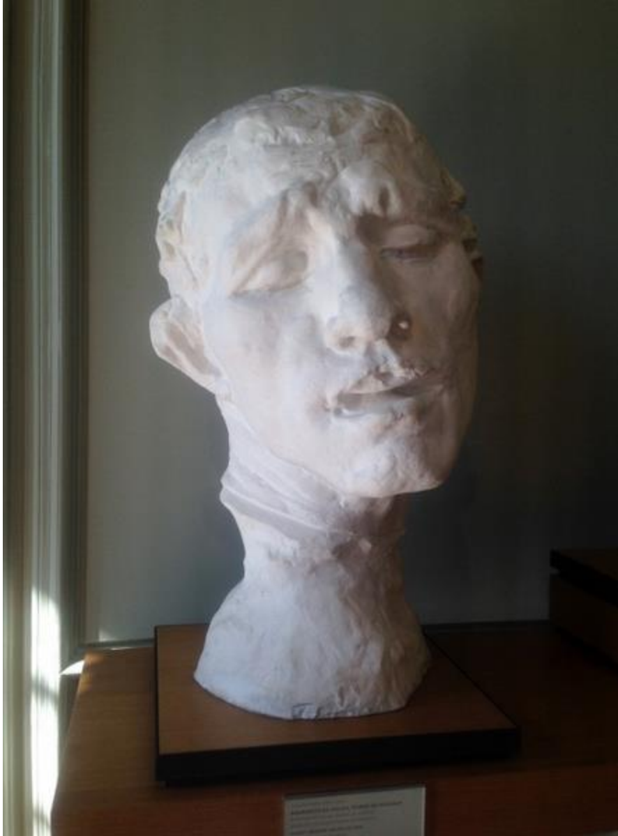
壞了鼻子的人( The Man with the Broken Nose )

羅丹於1840年生於法國巴黎，自幼喜愛藝術，年少即就讀美術學校，但在三十七歲之前的藝術生涯並不順遂。