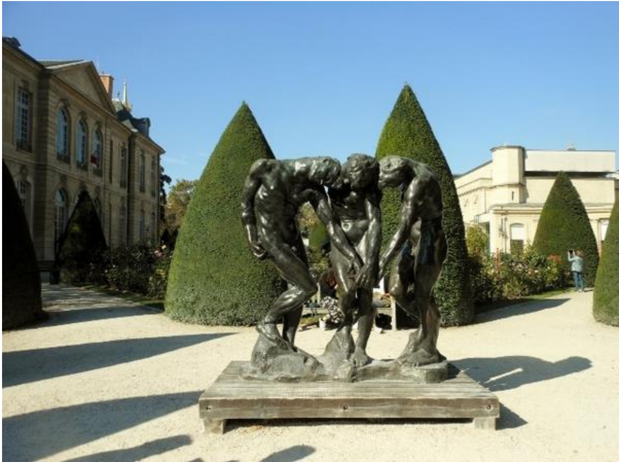
三個影子(羅丹名作)

結果，這個工藝美術館沒建成，羅丹卻為這扇門耗盡三十七年之餘生，而這扇門亦將羅丹的藝術生命推至最高峰。「地獄門」上的「三個影子」、「沉思者」與「吻」等浮雕後來皆被複刻成獨立作品，成為家戶喻曉的羅丹代表作。